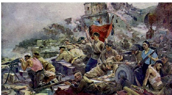
Евгений Алексеевич Зайцев «Оборона Брестской крепости в 1941 году»

Результатом этой атаки был разрушен водопровод, что в дальнейшем значительно усложнило положение защитников крепости. Вода требовалась не только для бойцов, которые были обыкновенными живыми людьми, но и для пулеметов.