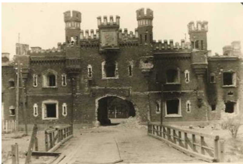
Брестская крепость, июль 1941 года фото