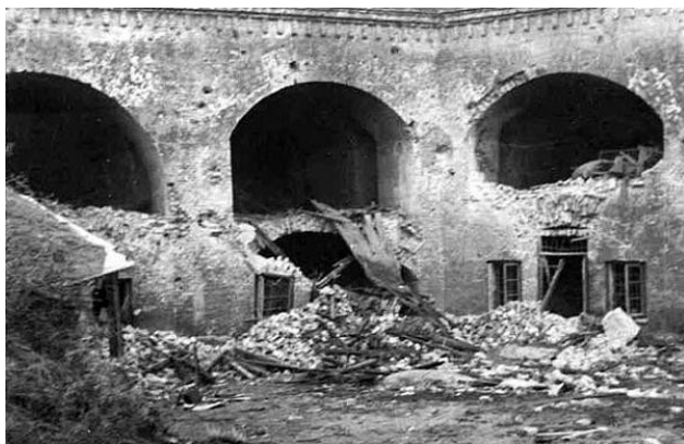
Оборона Брестской крепости фото

Быстро придя в себя после произошедшего потрясения от неожиданного и вероломного нападения противника, части гарнизона, оказавшиеся в тылу наступающих, смогли расчленить и даже частично уничтожить врага. Сильнейшее сопротивление противник встретил на Волынском и Кобринском укреплении.